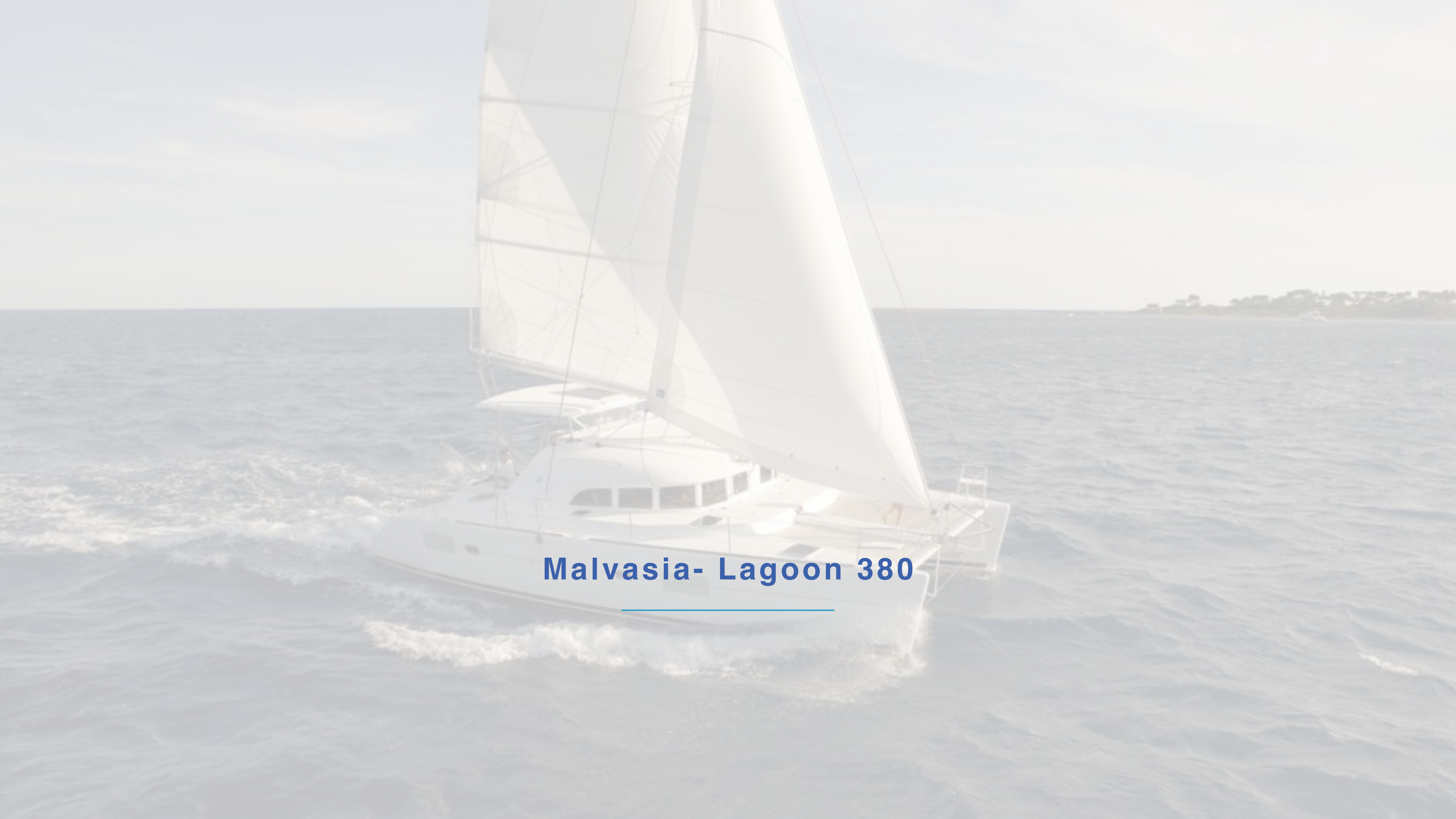
Malvasia- Lagoon 380